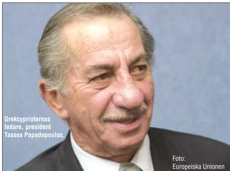
Grekcyprioternas ledare, president Tassos Papadopoulos.

EU:s utvidgning och framtid diskuteras. Det finns oro. Men på en punkt har EU lyckats – som ett fredsskapande projekt. Men med grekcyprioterna som medlemmar förs en hätskhet och rasism in i organismen.