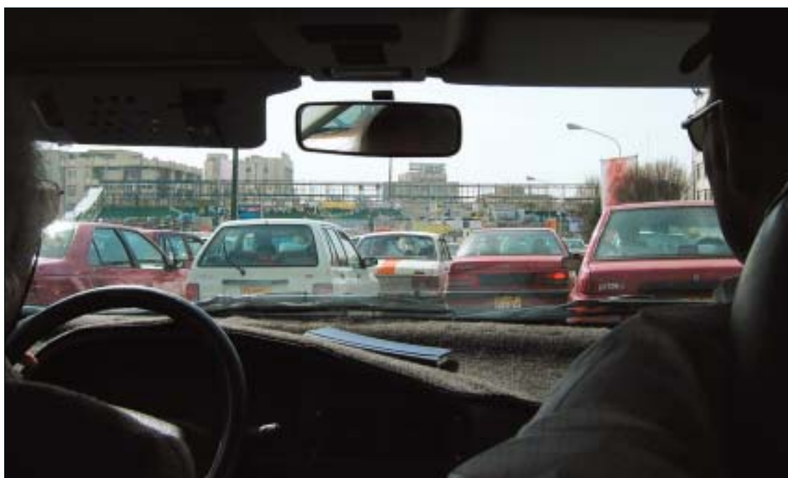
Trafik i Teheran.