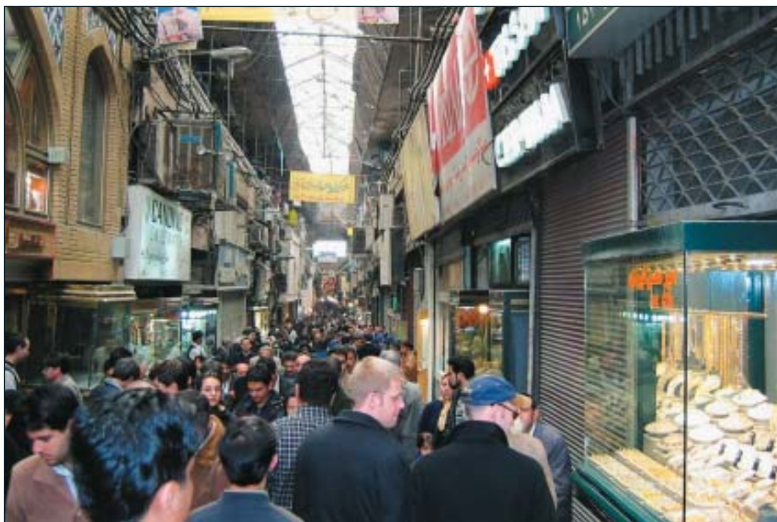
Bazaargata i Teheran.

USA, som inte har några diplomatiska förbindelser med Iran vidhåller sina sanktioner mot landet. Detta är något som förbittrar relationerna mellan länderna. Iran stödde USA vid invasionen av Afghanistan. Trots detta stöd utpekades landet som en av "ondskans axelmakter". Vid State Department i USA fokuseras mot en idé om "the Greater Middle East". Flera handläggare, tidigare specialiserade på forna Sovjetunionen, är idag omdirigerade till Mellanöstern. Tankarna om "The Greater Middle East" innebär att demokrati skall spridas till regionen. Andra värden som skall exporteras är fri handel och yttrandefrihet, krafter som inte kan eller får hejdas. Exporten av dessa värden är överord-