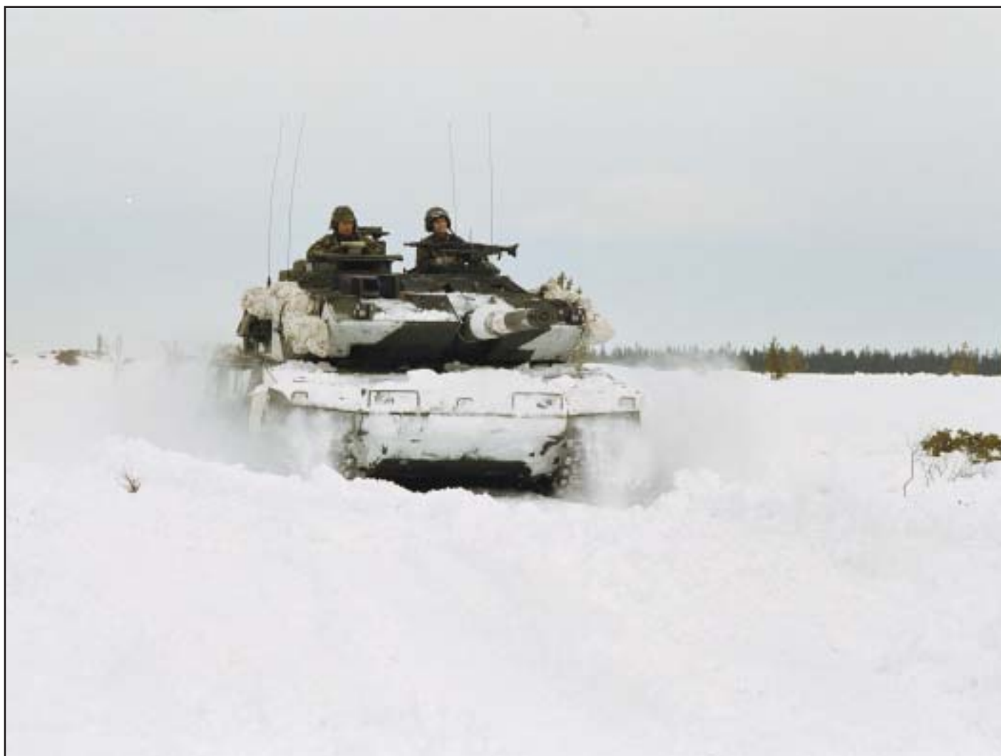
Från övning "Snöyra. 2000". För att öva chefer krävs fungerande förband.