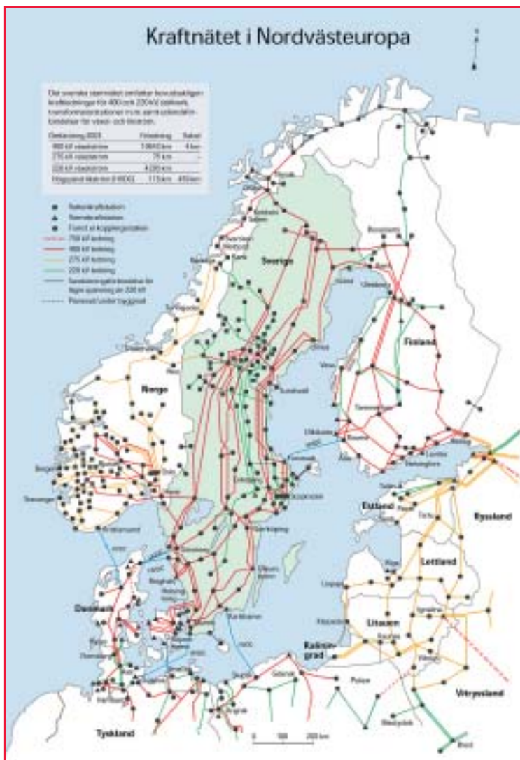
Elförsörjningen är en vital del av infrastrukturen. Karta: Svenska Kraftnät.

verkansområdet ska, enligt regeringen, åstadkomma en sådan robusthet och flexibilitet hos den tekniska infrastrukturen att samhällets väsentligaste behov kan tillgodoses vid allvarliga avsiktliga eller oavsiktliga störningar i fred såsom sabotage, terrorhandlingar eller allvarliga olyckor.