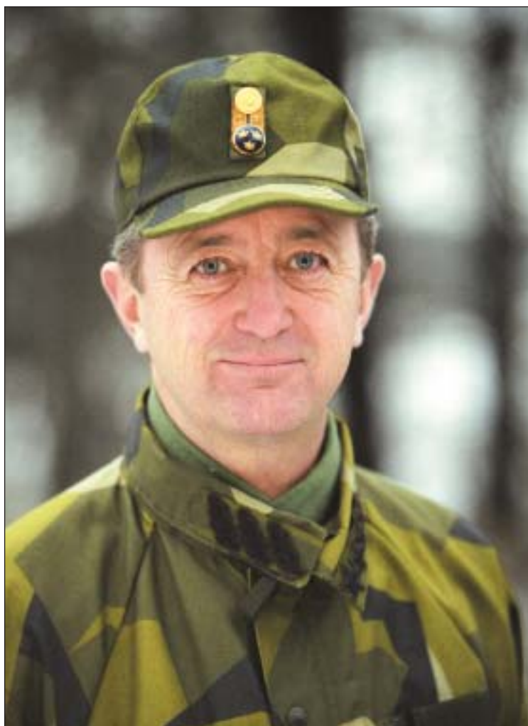
ÖB Håkan Syrén

– Jag har all anledning att kräva tydliga svar om uppgifter och resurser i ett skede av total ominriktning av det svenska försvaret med en i EU-perspektiv ny inriktning av svensk säkerhetspolitik. De internationella insatserna med svensk trupp och ledning måste kunna kombineras med en användning av dessa förband i det territoriella försvaret av Sveriges gränser och landområden. Strävan måste alltså vara att skapa militära enheter som kan användas både internationellt och nationellt.