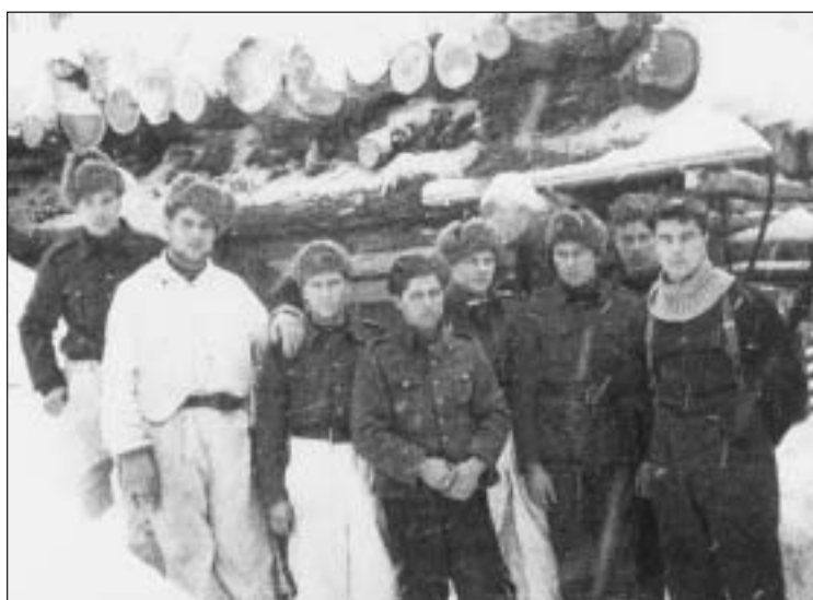
Före aktionen mot stödjepunkten "Fågeln".

Filmen bygger på hans krigserfarenheter som finländsk officer vid svenskspråkiga 61. infanteriregementet (IR 61). Han förekommer i filmen i egen person i några sammanbindande berättande avsnitt; hans roll i övrigt spe-