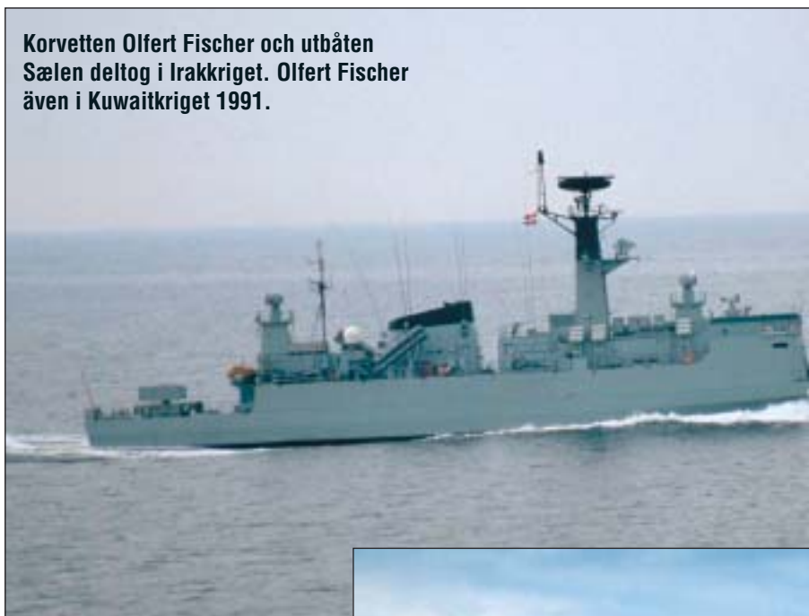
Korvetten Olfert Fischer och utbåten Sælen deltog i Irakkriget. Olfert Fischer även i Kuwaitkriget 1991.

egen hand. Organisationer som NATO, EU och FN är fortfarande centrala, men Danmark måste också kunna arbeta i koalitioner mellan länder.